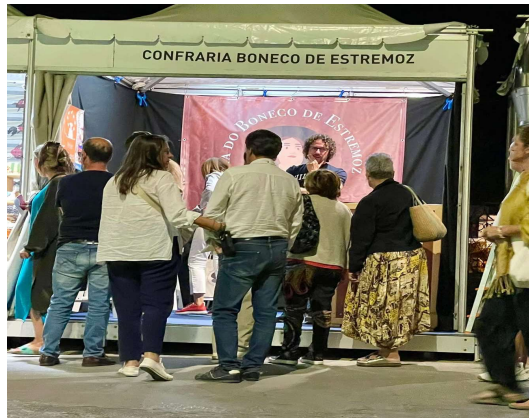
X Feira da Dieta Mediterrânica em Tavira – 2024