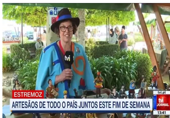
1ª Edição Mercado Património Cultural Imaterial 2025 – Organização Confraria Boneco de Estremoz