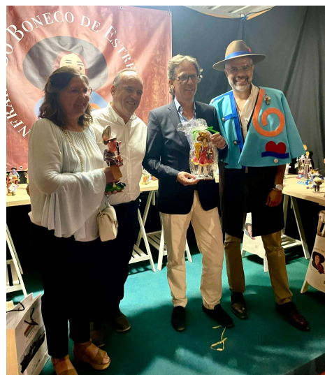
Mostra Internacional de Artesanato e Cerâmica de Barcelos – 2024