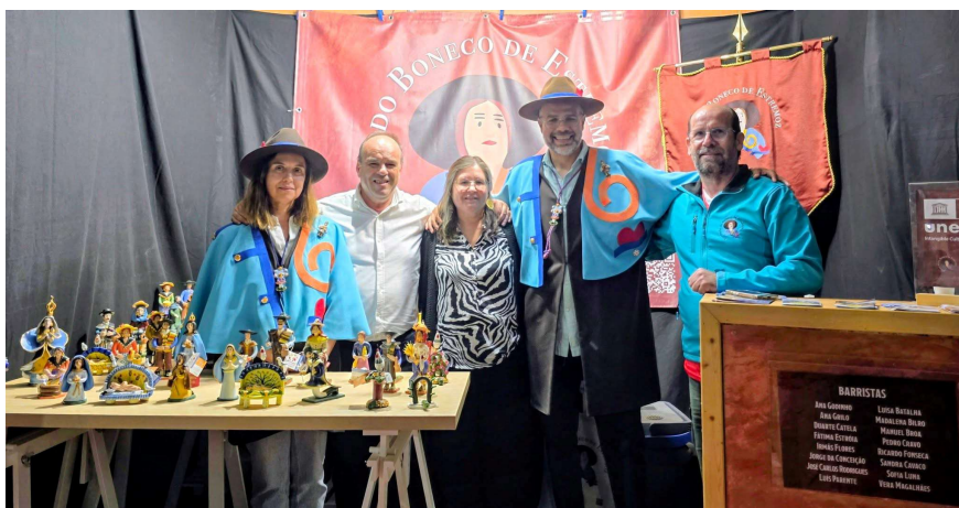
Mostra Internacional de Artesanato e Cerâmica de Barcelos – 2025