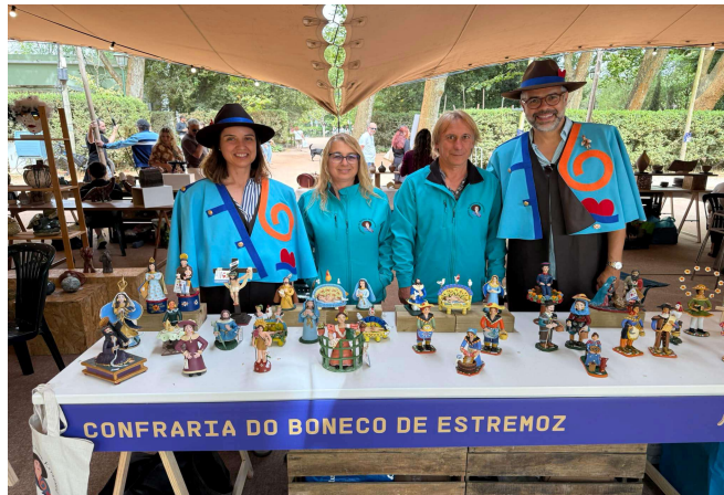
Mestra – Mostra Mercado de Cerâmica das Caldas da Rainha em 2025