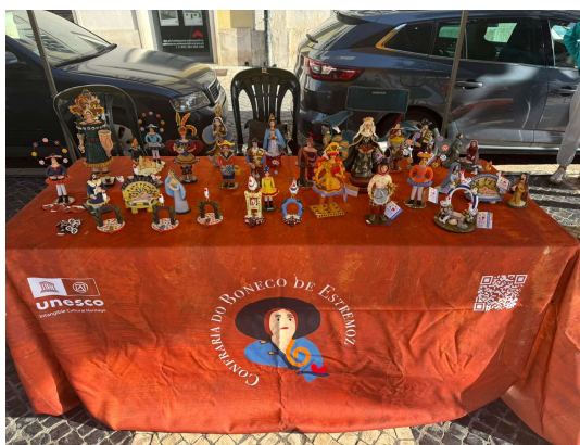
Artesanato na Praça – Caldas da Rainha – Setembro 2025