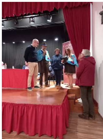
Tertúlia Nacional de Artesanato em 2024