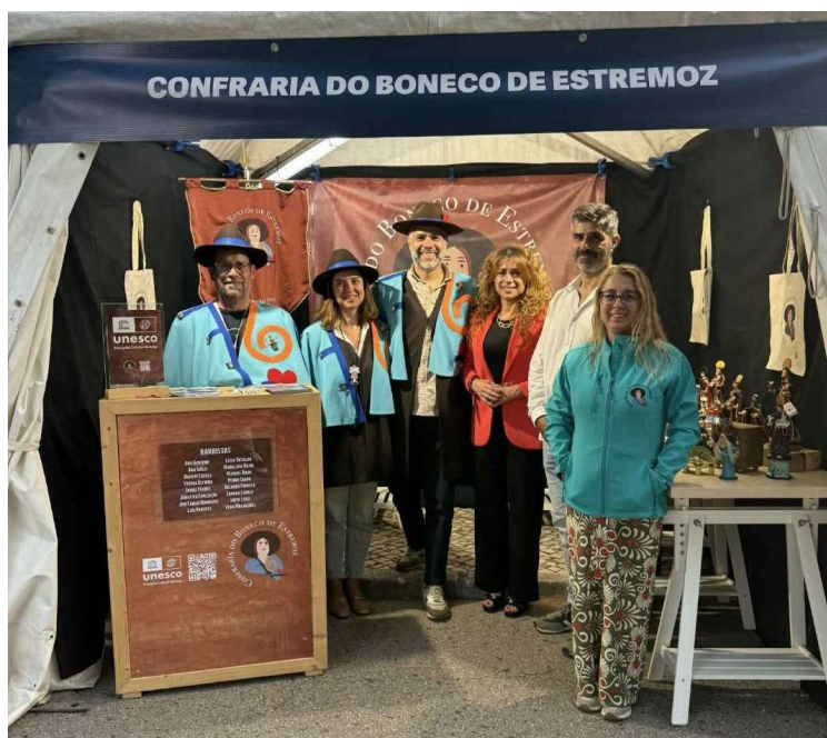
Cidade Das Tradições – Inatel - 2025