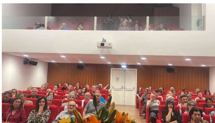
Tertúlia Nacional de Artesanato em 2025