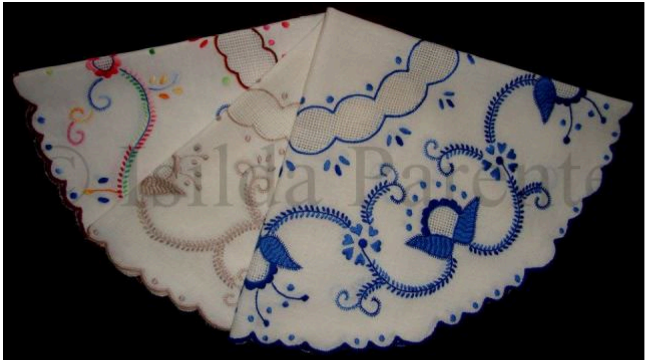
Figura 7 - Centros