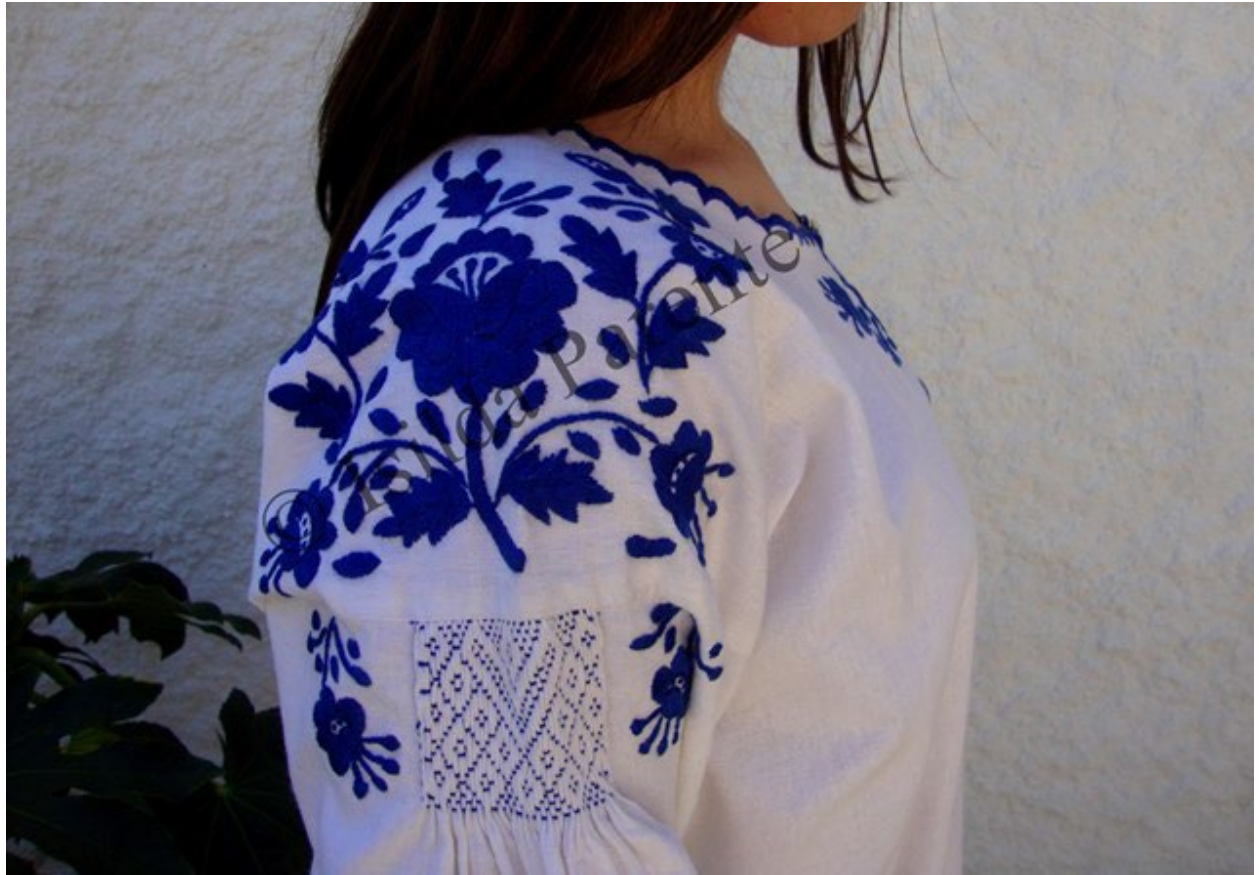
Figura 3 - Camisa lavradeira linho