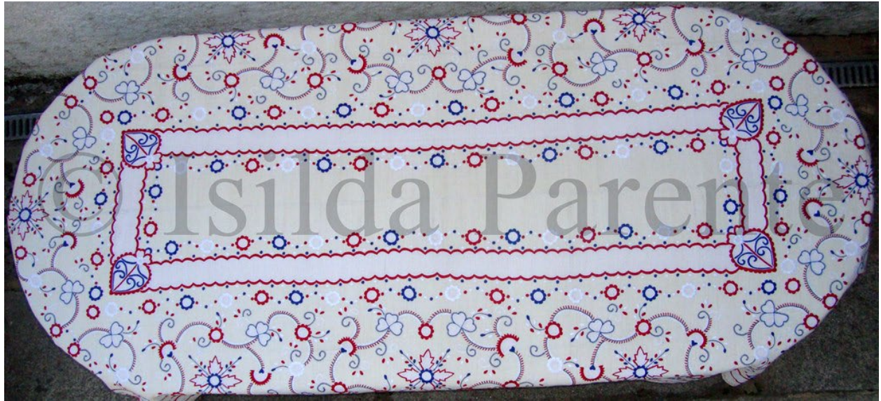
Figura 11 - Toalha rica 2