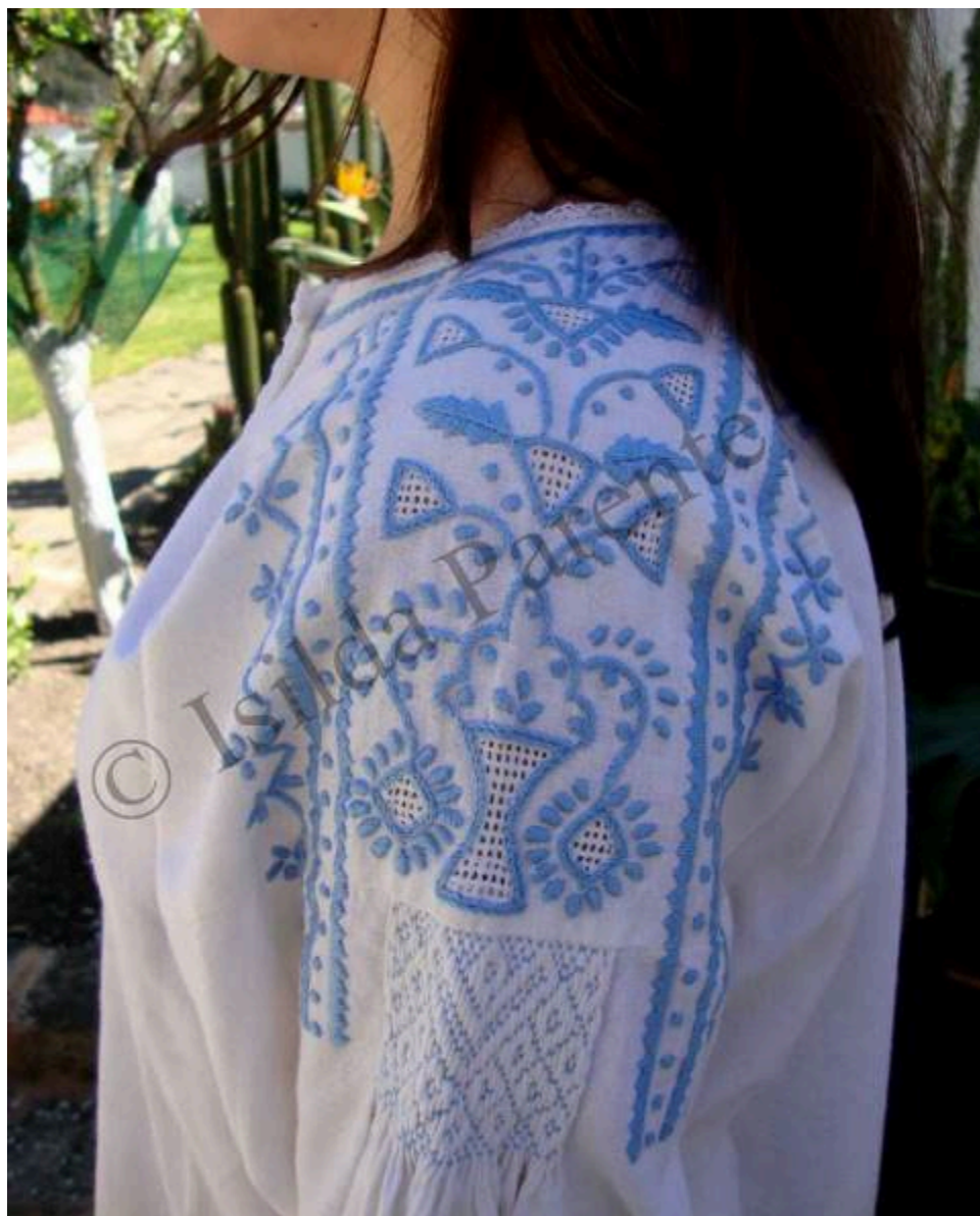
Figura 4 - Camisa tradicional rica