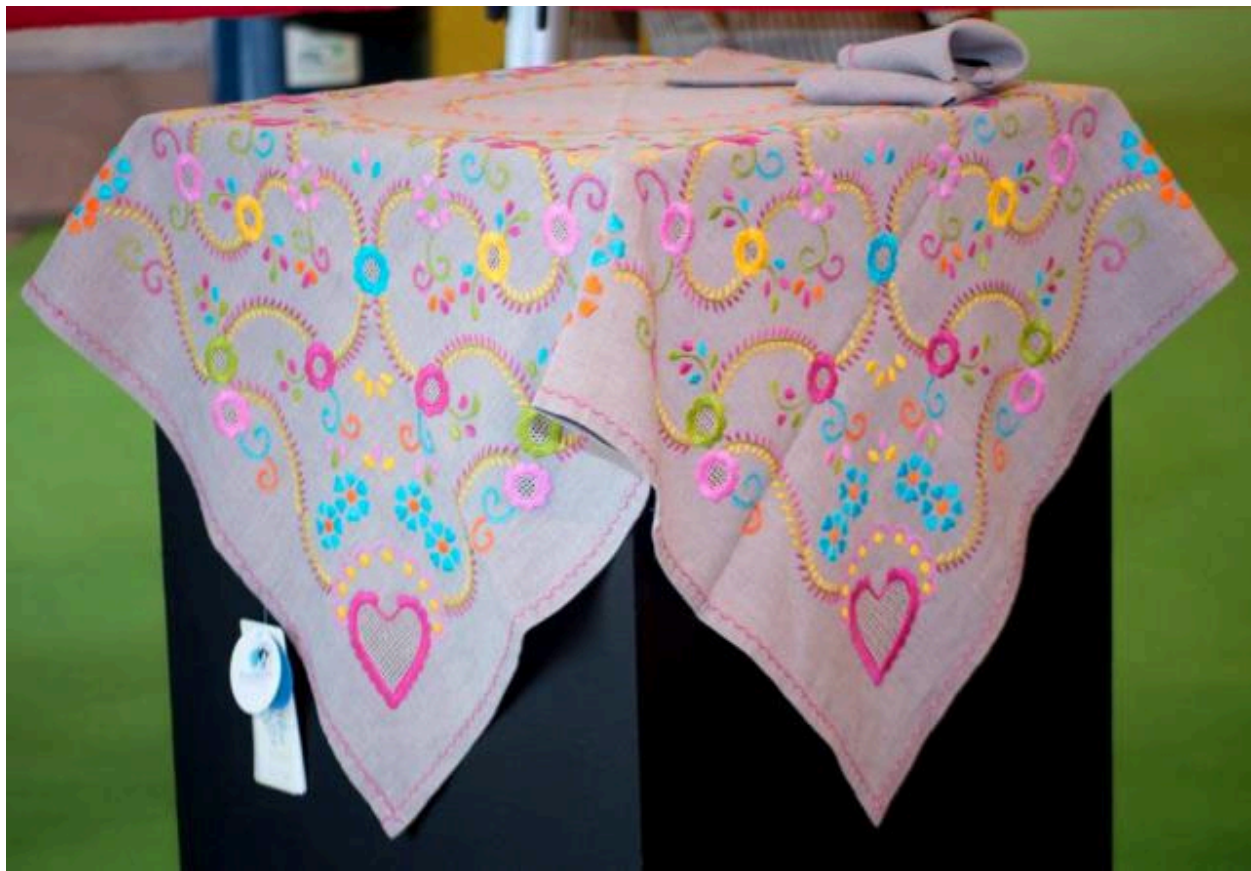
Figura 9 - Toalha de chá rica