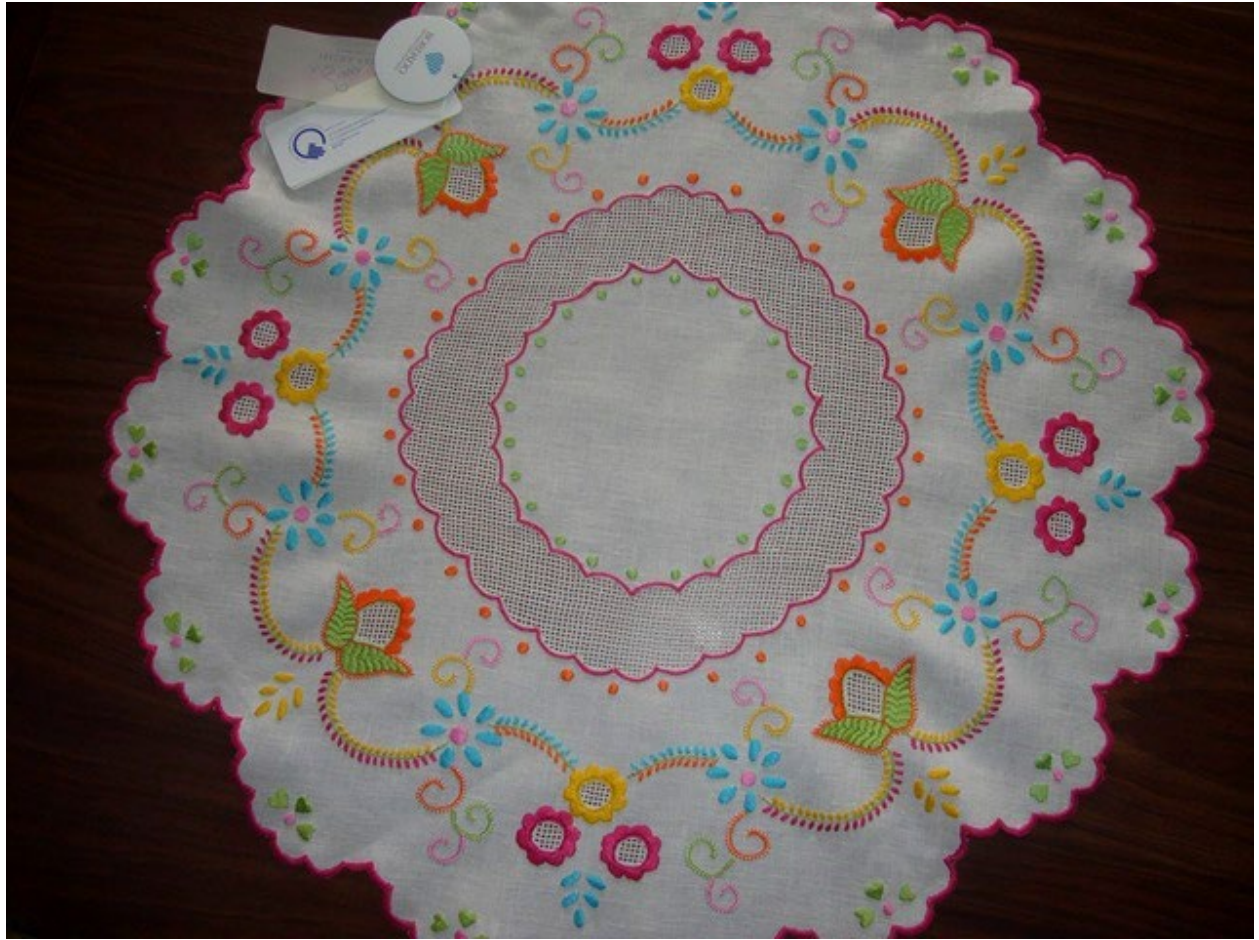
Figura 5 - Centro