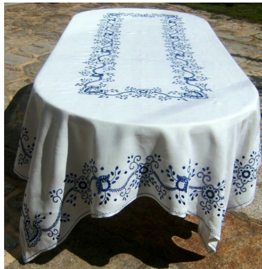
Figura 12 - Toalha silvas