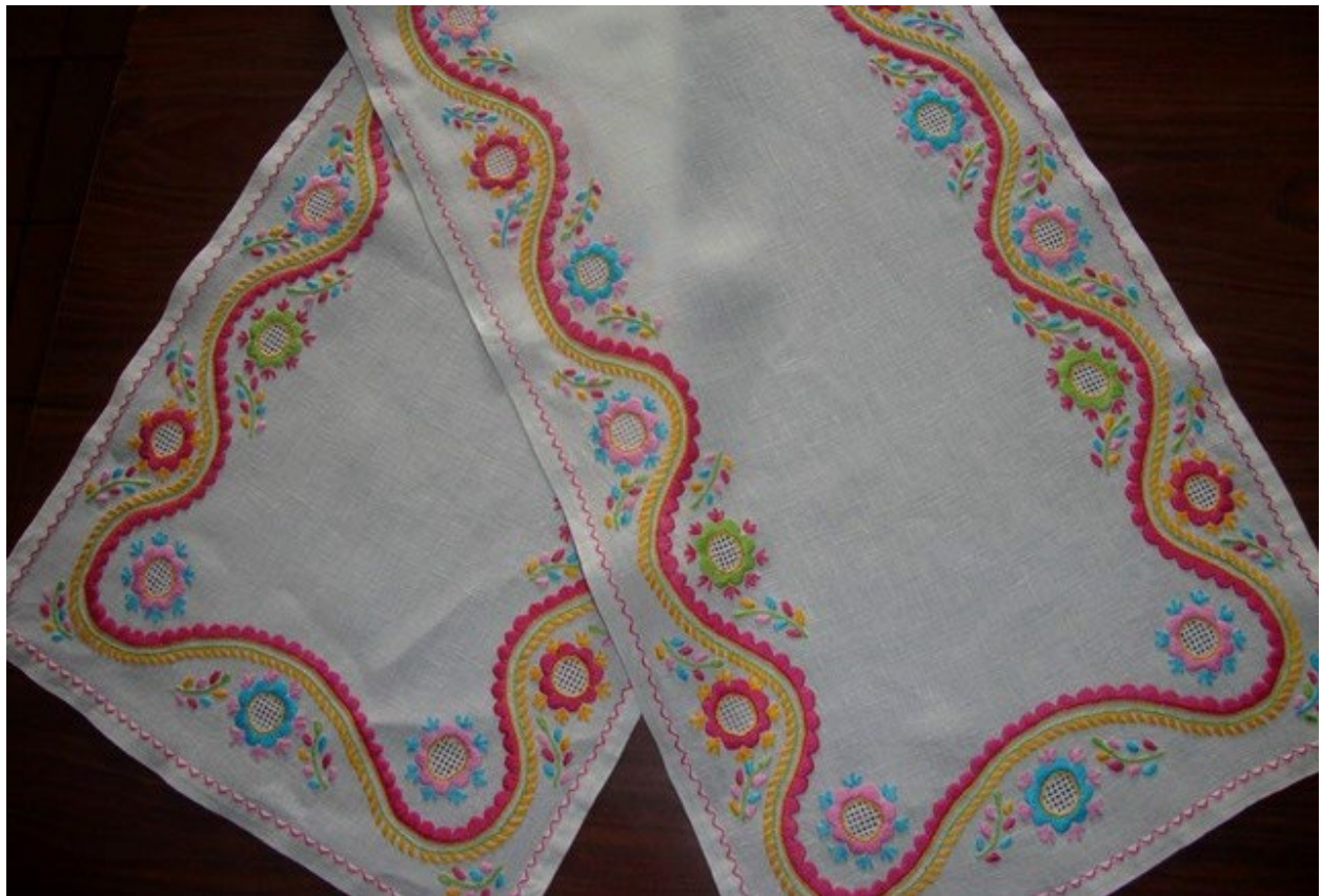
Figura 6 - Corredor silvas rico