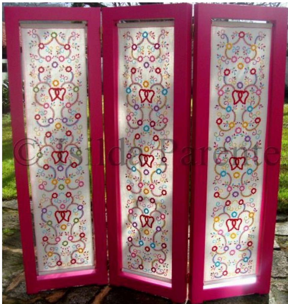
Figura 2 - Biombo