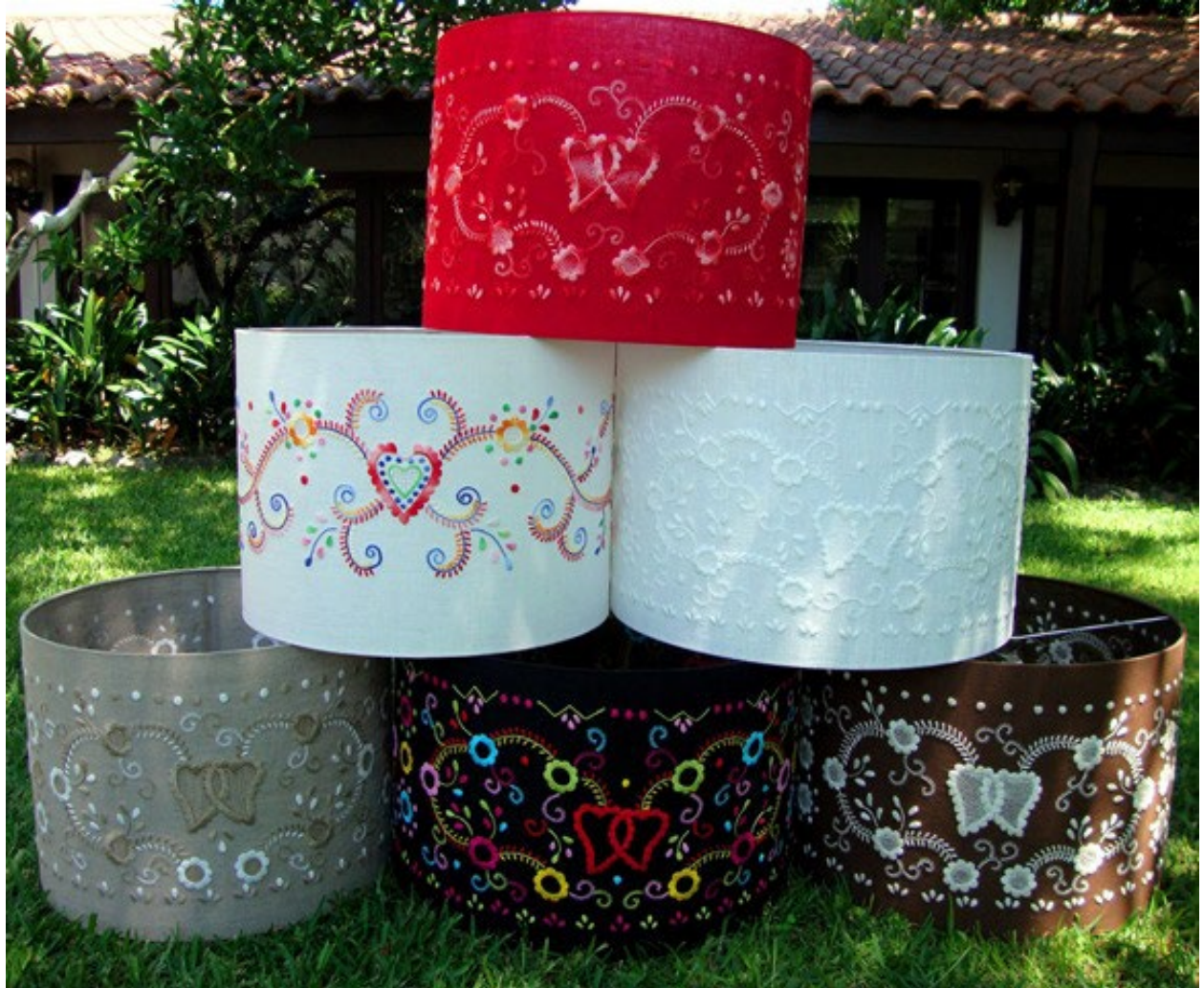
Figura 1 - Abajures