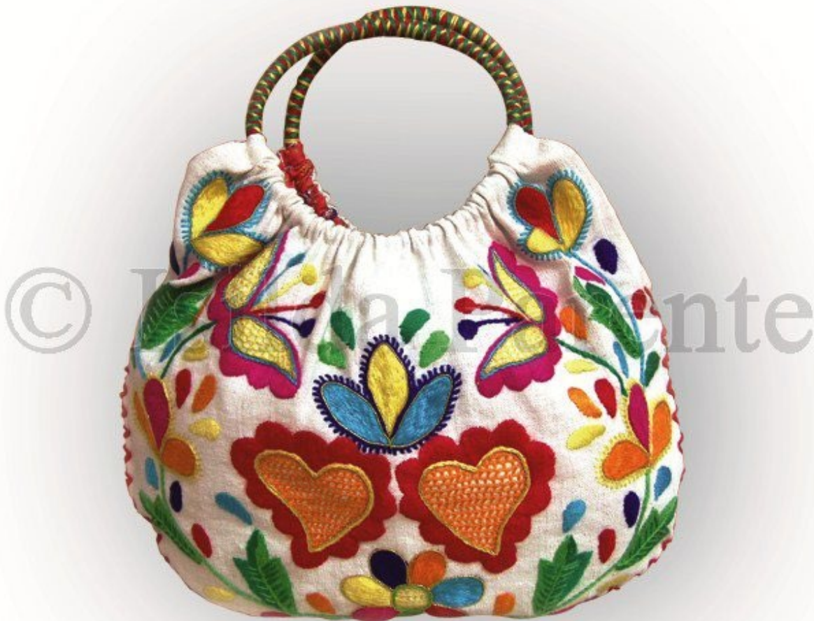
Figura 8 - Saco rico